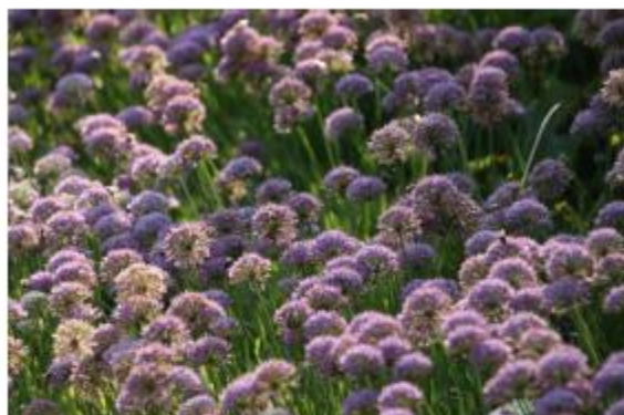
Berg-Lauch - Allium senescens ssp. montanum