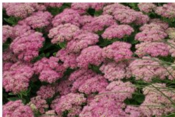
Hohe Fetthenne - Sedum Telephium -Hybride 'Herbstfreude'