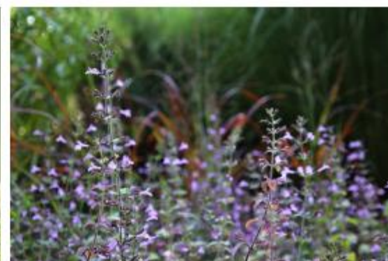
Echte Bergminze - Calamintha sylvatica