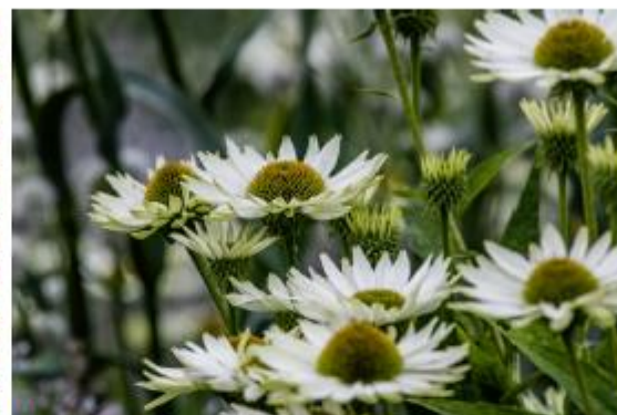
Weißer Sonnenhut - Echinacea purpurea Hybride 'Virgin'