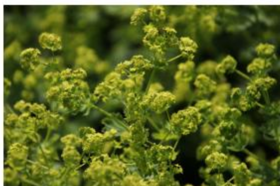
Zierlicher Frauenmantel, Kahler Frauenmantel - Alchemilla epipsila