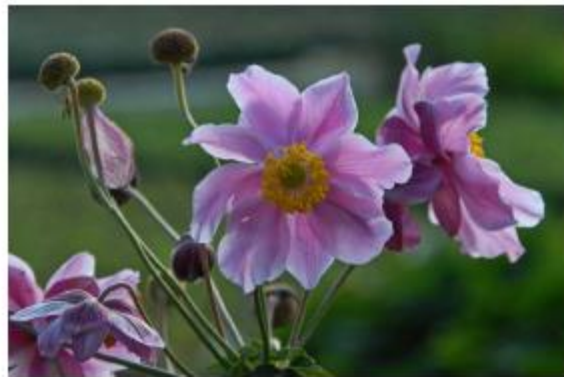
Herbst-Anemone - Anemone tomentosa 'Septemberglanz'