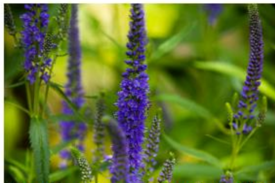
Hoher Wiesen-Ehrenpreis - Veronica longifolia 'Blauriesin'