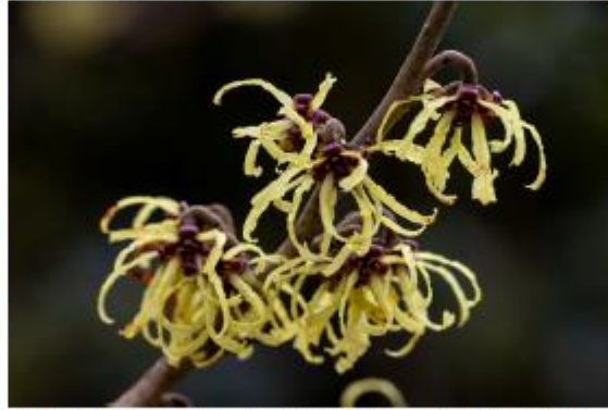
Hybrid-Zaubernuss - Hamamelis x intermedia 'Arnold Promise'