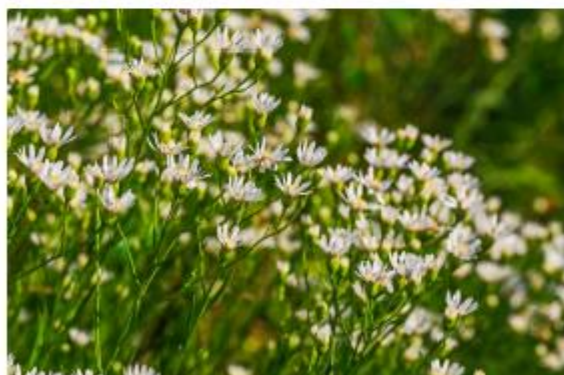
Weiße Prärie-Aster, Hochland Aster - Aster ptarmicoides