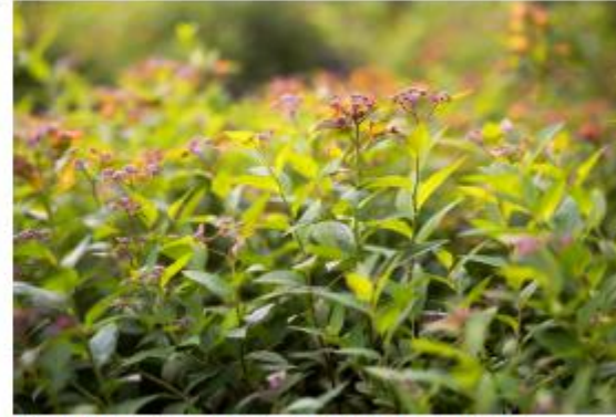
Rote Strauchspiere - Spiraea x bumalda 'Erebelii'