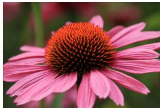
Purpur-Sonnenhut, Igelkopf - Echinacea purpurea