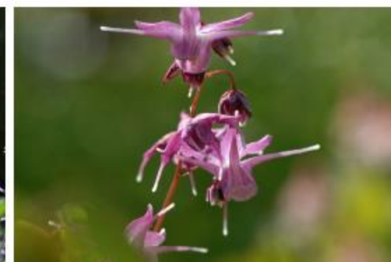
Violette Elfenblume - Epimedium grandiflorum 'Lilafee'