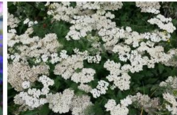
Ausläufer-Schafgarbe - Achillea nobilis subsp. neilreichii