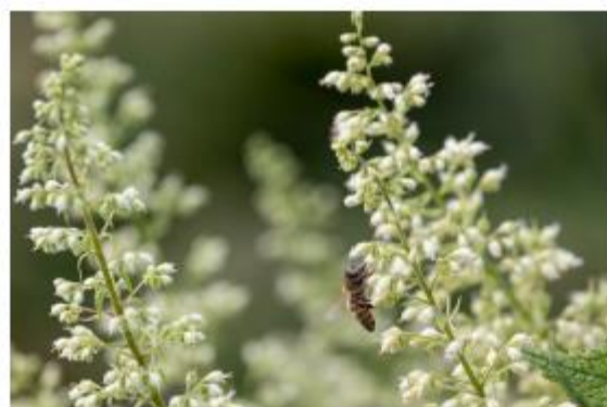
Zottiges Silberglöckchen - Heuchera villosa var. macrorrhiza