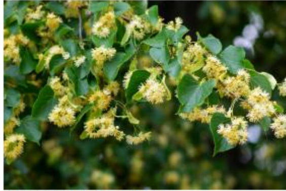
Winter-Linde - Tilia cordata