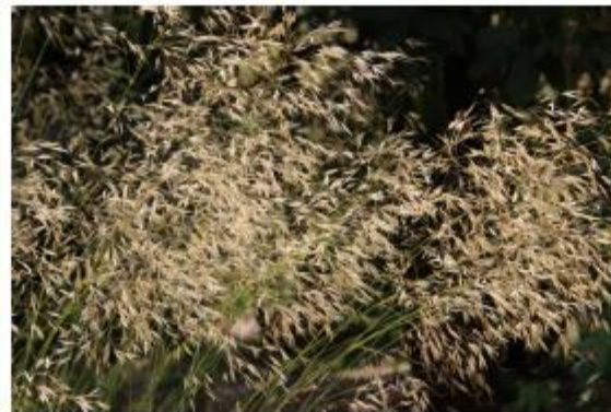
Pyrenäen-Riesen-Federgras - Stipa gigantea