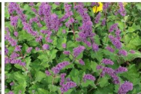
Quirlblütiger Salbei - Salvia verticillata 'Purple Rain'