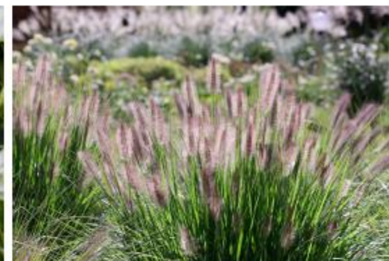
Kleines Lampenputzergras - Pennisetum alopecuroides 'Hameln'