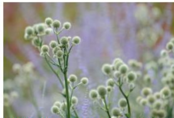
Palmilien-Mannstreu - Eryngium yuccifolium