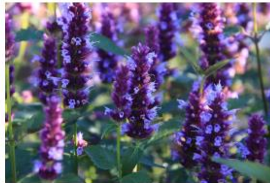
Duftnessel, Purpur-Blaunessel - Agastache Hybride 'Purple Haze'