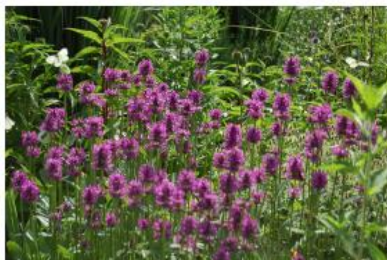
Dichtblütiger Ziest - Stachys monieri 'Hummelo'