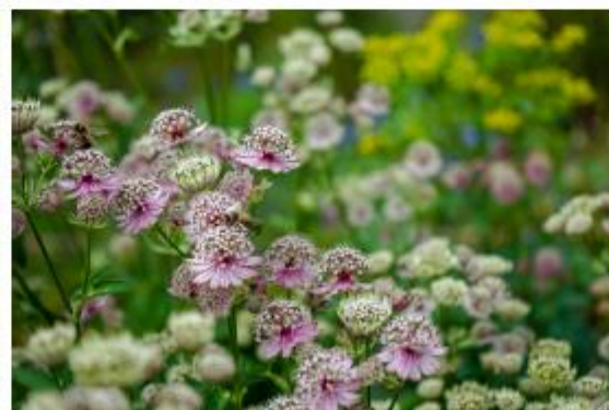
Große Sterndolde - Astrantia major