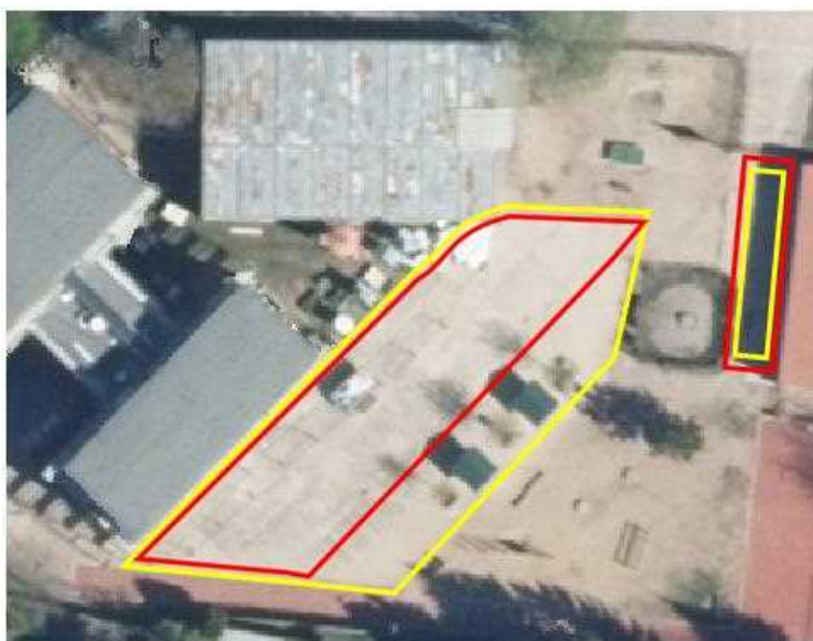
Auszug Brandenburg Viewer

Der Fachbereich Bauwesen/Stadtentwicklung empfiehlt die Vergabe der Bauleistungen an die Fa. GUT GmbH.