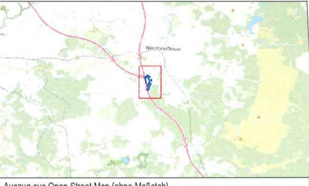
Auszug aus Open Street Map (ohne Maßstab)