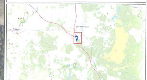
Auszug aus Open Street Map (ohne Maßstab)